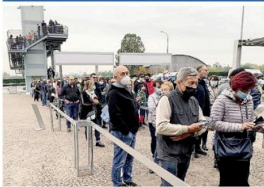
In attesa fin sulla passerella del parcheggio per visitare la Mostra dell'Artigianato.

Ernesto Galigani e galigani@laprovincia.it, Emilio Frigerio e frigerio@laprovincia.it, Nicola Panzeri e panzeri@laprovincia.it, Pier Carlo Battè e battè@laprovincia.it, Roberto Catini e catini@laprovincia.it, Raffaele Foglia e foglia@laprovincia.it