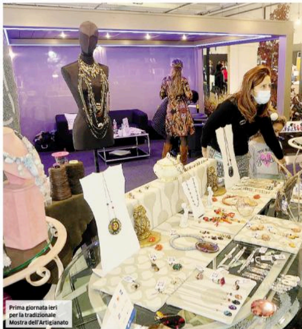
Prima giornata ieri per la tradizionale Mostra dell'Artigianato