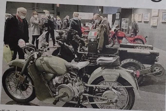
Lo stand dedicato alla Moto Guzzi una delle attrazioni della Mostra dell'Artigianato di quest'anno. In esposizione diversi modelli storici